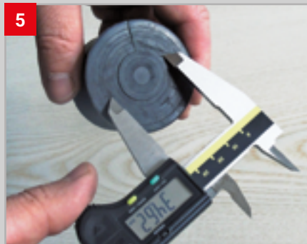
5 Durchmesser auf ein Zwiebel- schnitt-Nest übertragen