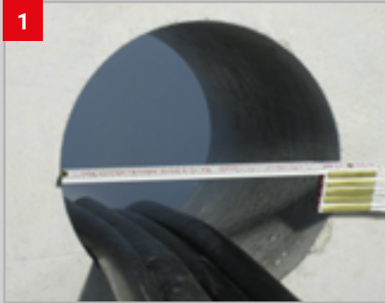
1 Ausgangssituation: Verlegte Kabel