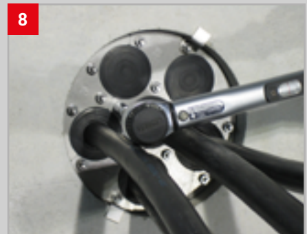
8 Muttern anziehen! Fertig! Wasserdicht bis 2,5 bar!

UGA SYSTEM-TECHNIK GmbH & Co. KG Gebäudetechnische Systeme Heidenheimer Str. 80 – 82, 89542 Herbrechtingen Tel. +49 7324 9696-0, Fax +49 7324 9696-96 info@uga.eu, www.uga.eu