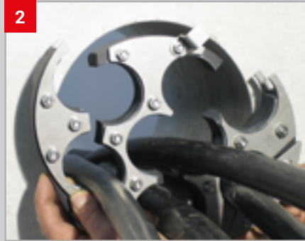
2 Zwiebelschnitteinsätze entfernen und aufgeklappte GPD um Kabel herumlegen