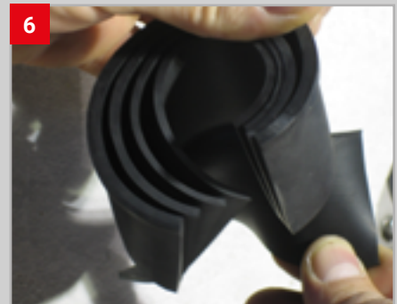
6 Nicht benötigte Zwiebelschnitt- ringe entfernen