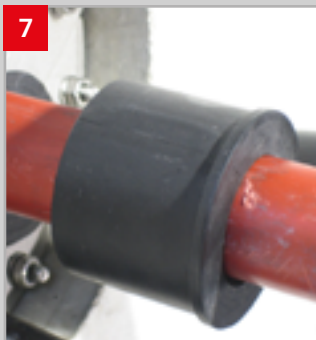
7 Zwiebelschnitteinsätze nach einander einsetzen!