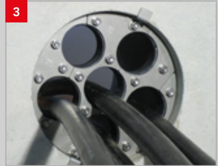
3 GPD (A) -ZS einsetzen